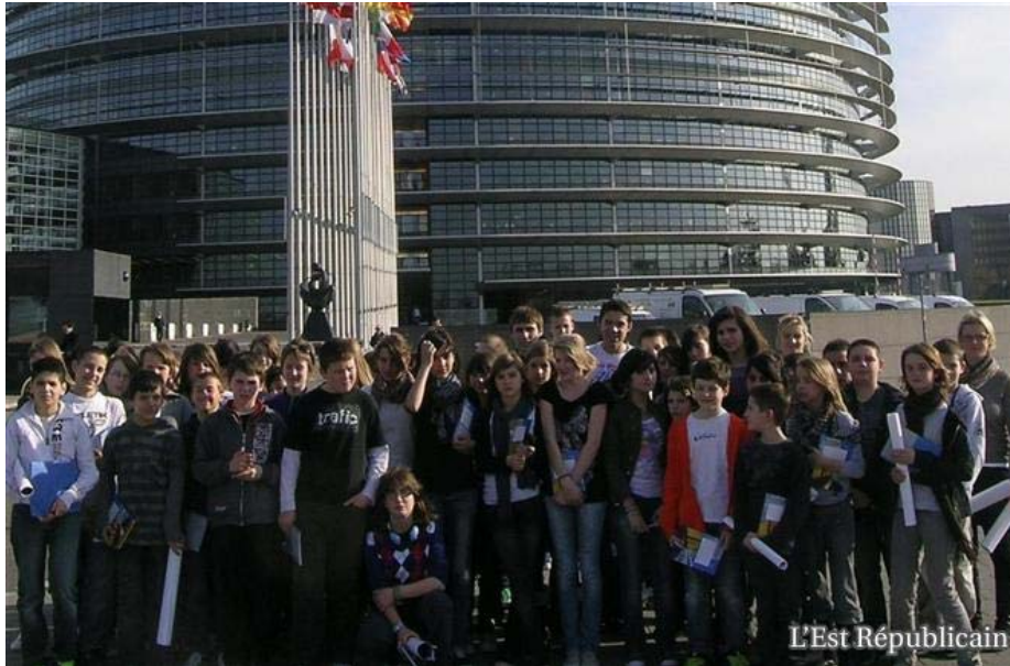
De futurs députés européens ?